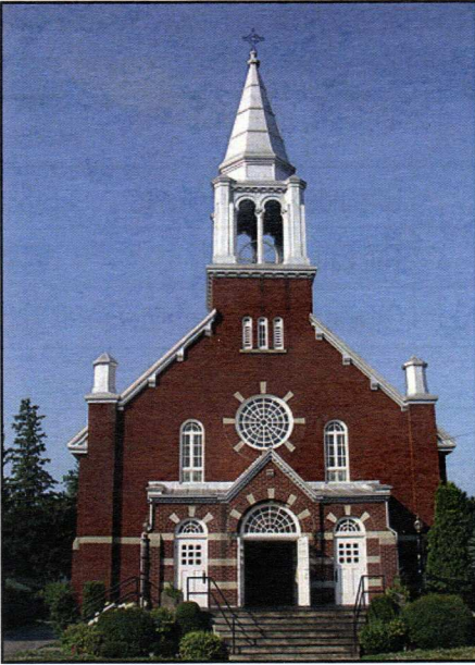
Construit en / Built in 1896 Rénové en / Renovated in 1920